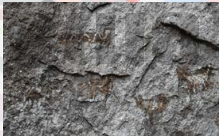
Figuras de animales plasmadas en los muros