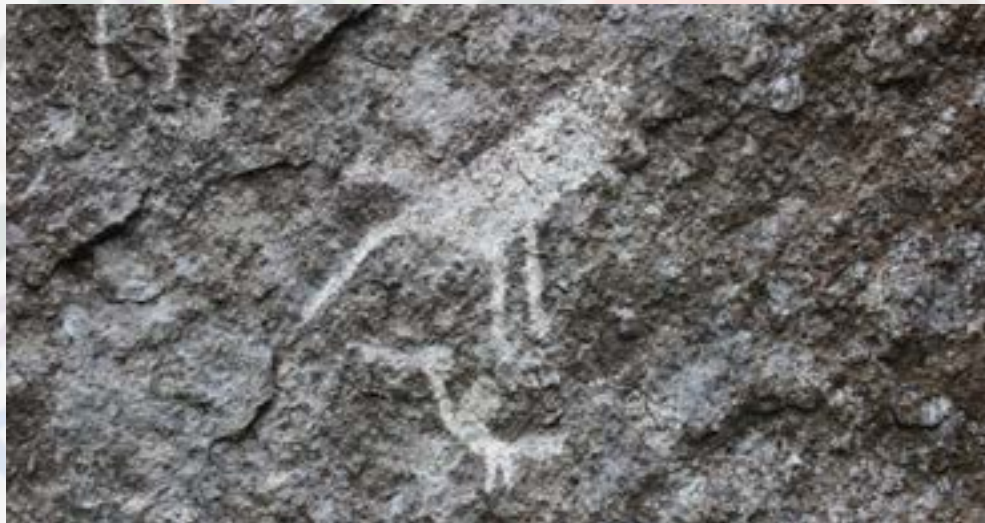
Izquierda: Siluetas de aves plasmadas en la pared rocosa. Derecha: El Cirio