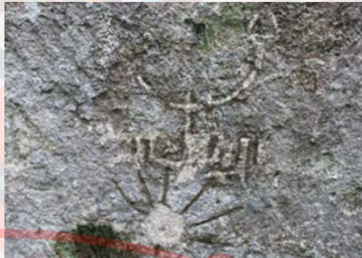
Pinturas rupestres cerca de “El Cirio”

Se dice que Faith Blight, a las bordadoras les sugirió que usaran hilo de mejor calidad, para que los colores no se desvanecieran tan pronto y mantuvieran esa vivacidad.